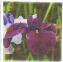
県花: ハナイロイロ