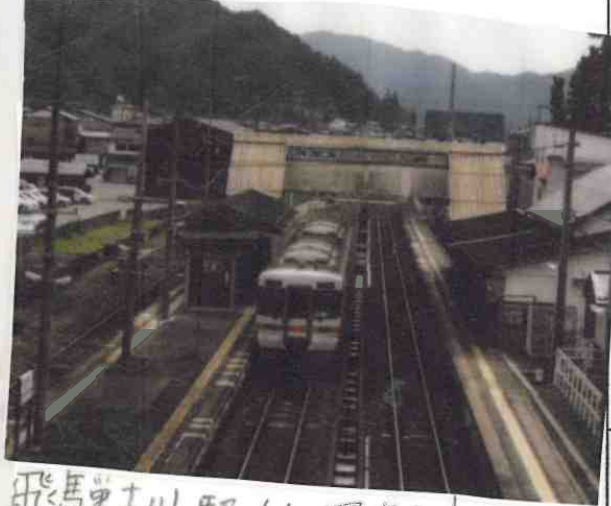
飛騨守古川駅 (上写真)

岐阜県のJR高山本線「飛騨守古川駅」 瀧が三葉に会いに行くシーンで登場した駅です。 映画のこのシーンをリアルに味わうことができます。