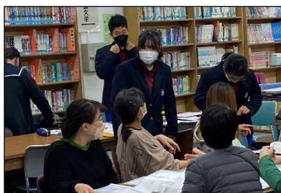
サンプルの制服を試着する委員のみなさん

令和6年度入学生からリニューアルする制服のプロデュースをどの制服メーカーに委託するかについて、プロポーザル方式（複数の業者に企画を提案してもらい、その中から優れた提案を行った業者を選定すること）で業者選定を行いました。委員である本校の先生方、小学校の先生方、保護者、生徒代表、小学生代表による厳正な審査の結果、制服メーカーは「スクールタイガー（瀧本株式会社）」に決定いたしました。販売店様は従来どおりとなります。今後、アンケート等を実施し、たくさんの意見を吸い上げながら、半年かけて新しい制服をみんなで創っていきたいと思いますのでご協力をお願いいたします。