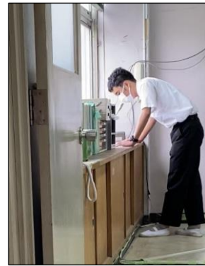
(放送委員会によるお昼の放送)

このテーマを合言葉に、今年度はできるだけ生徒のみなさんが自分の意見を発表したり自分を表現したりする場を大事にしています。授業の中ではもちろん、それ以外の学校生活の中でも、生徒のみなさんがキラリと輝く場面が増えてきました。部活動以外の課外活動として、PBL、英会話教室、ダンスチームなどで自分を表現している人たちもたくさんいます。放送委員会の活動も活発になってきました。先日の朝学活では、全校生徒に向けてたった一人で『プライド月間』に関する発表をしてくれた生徒もいました。まさに今年度の一丘中学校を象徴するすてきな一面でした。