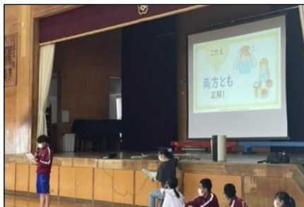
(保健委員会による「睡眠学習」)

このテーマを合言葉に、今年度はできるだけ生徒のみなさんが自分の意見を発表したり自分を表現したりする場を大事にしています。授業の中ではもちろん、それ以外の学校生活の中でも、生徒のみなさんがキラリと輝く場面が増えてきました。部活動以外の課外活動として、PBL、英会話教室、ダンスチームなどで自分を表現している人たちもたくさんいます。放送委員会の活動も活発になってきました。先日の朝学活では、全校生徒に向けてたった一人で『プライド月間』に関する発表をしてくれた生徒もいました。まさに今年度の一丘中学校を象徴するすてきな一面でした。