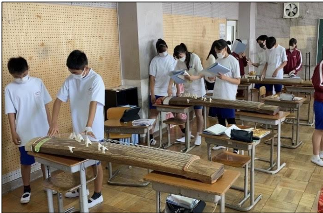
(音楽の授業で琴の演奏の発表)